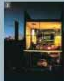
4 | Göttingen (Haus 4), Göttingen, Niedersachsen, USA, Villa, Manchester-Str. 20, Hannover, 1993 | Die Garage verbindet den Wohnraum mit dem Außenbereich zum Garten