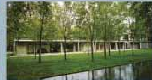
5 | Los Angeles (Haus 5), Los Angeles, California, USA, Villa, Beverly Hills, 1997 | Wohnraum: Interiors by Interiors | LT, der das Auto in der Garage sichtbar macht, ist ein integraler Teil des Hauses, das die Garage mit dem Wohnraum verbindet