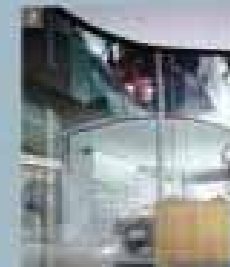
7 | Los Angeles (Haus 7), Los Angeles, California, USA, Villa, Beverly Hills, 1997 | Die Garage verbindet den Wohnraum mit dem Außenbereich zum Garten